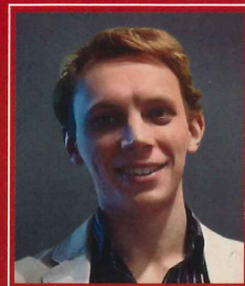
ステパン コシギン