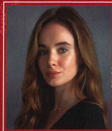
マルガリータ ポチヴァロワ